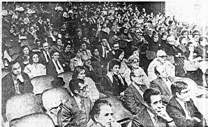
Médicos, psicólogos, religiosos, sociólogos, historiadores, professores, enfermeiros, escritores, estudantes, jornalistas, acorreram, de vários pontos do país, ao colóquio realizado o semana passada em Lisboa sobre a nossa relação com a morte

Ainda hoje, nas ilhas Fiji, se o morto é um chefe tribal, as mulheres devem seguir para a morte com ele, para o servir, sendo estranhaladas e por vezes até do marido morrer. Sabemos que os reis etíopes (500 AC) foram enterrados juntamente com as suas mulheres, escravos e cavalos. Na Índia era costume, até há pouco, as mulheres lançarem-se nas pirâmides dos maridos para que a morte não os separasse.